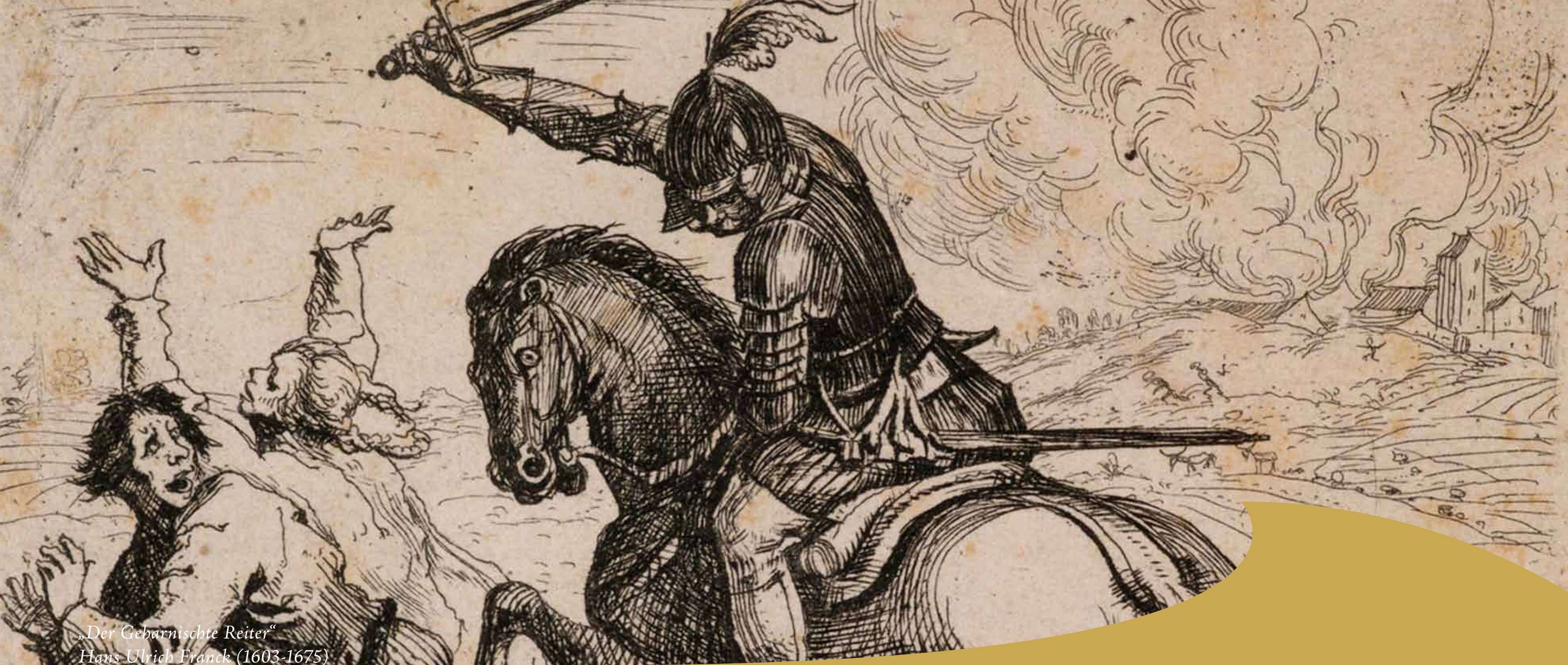
„Der Geharnischte Reiter“ Hans Ulrich Franck (1603-1675)