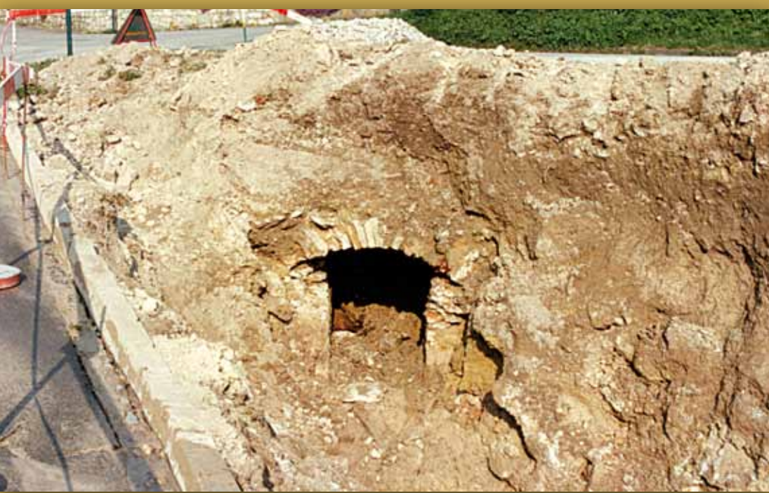
Die alte Brunnenstube

Helmut Breimayer, dem einstigen Ortsvorsteher, ist es zu verdanken, dass trotz vieler Schwierigkeiten mit Tiefenbohrungen und schwe-