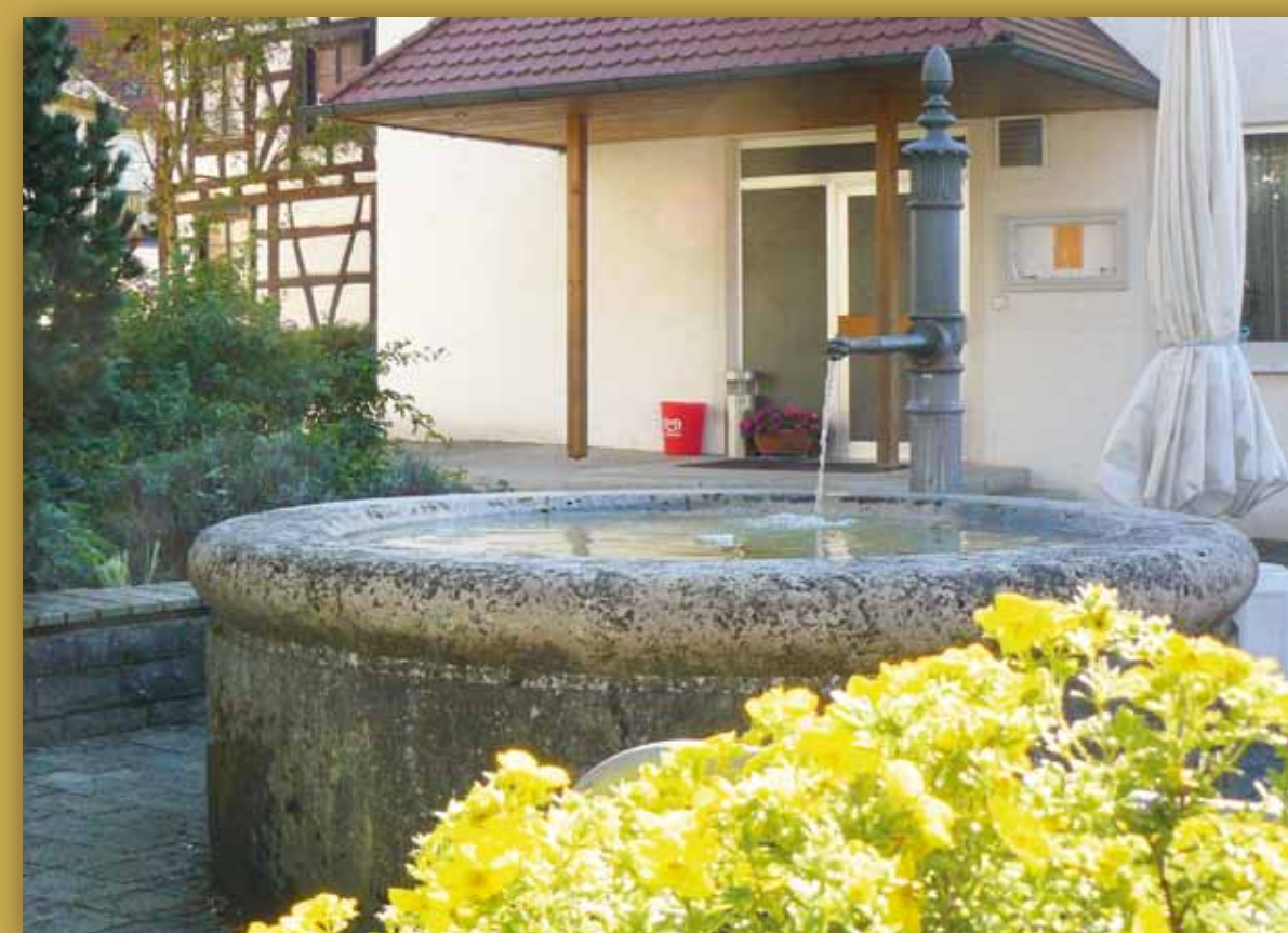
Der Dorfbrunnen

Die Hartnäckigkeit zahlte sich aus und in zwei Meter Tiefe stieß ein Bagger auf die alte Brunnenstube. Nur einen Meter tiefer stieß man dann auf die Quelle, deren Schüttung ausreichte, um den Dorfbrunnen zu füllen.