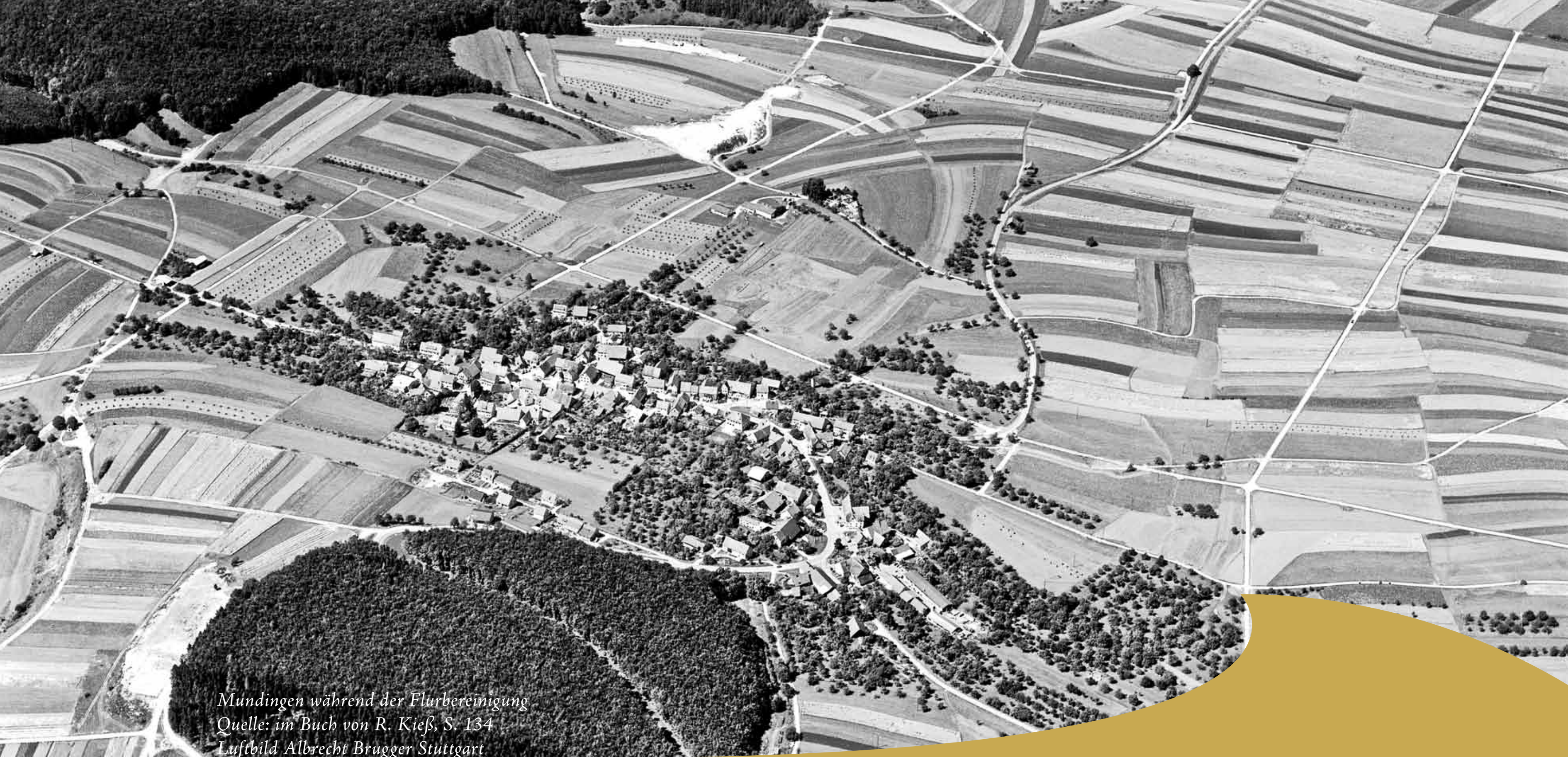
Mündingen während der Flurbereinigung Quelle: im Buch von R. Kieß, S. 134 Luftbild Albrecht Brügger Stuttgart