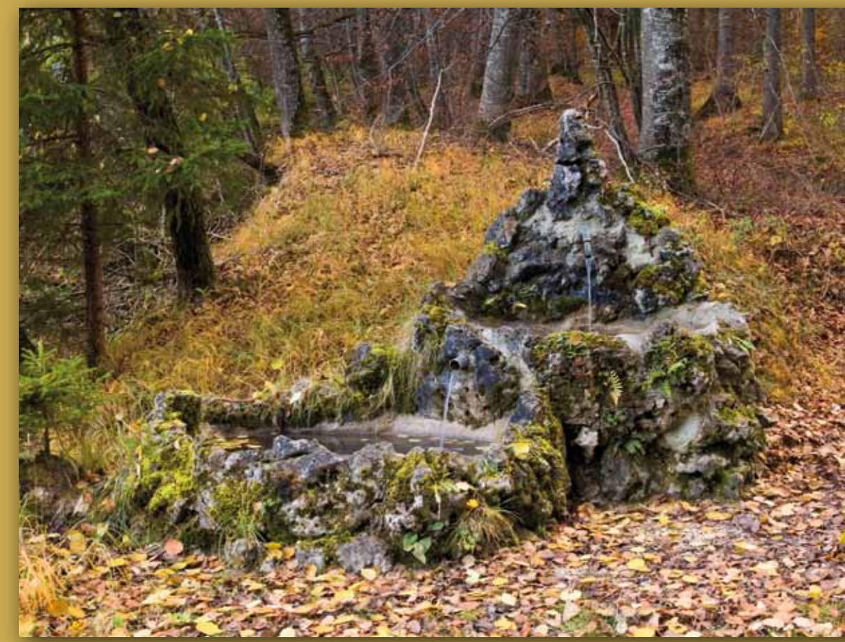
Brunnen im Tiefental

Vielzahl schmaler Grundstücke wurde getauscht und zusammengelegt, neue Wege geschaffen. Als Zugabe – ohne landwirtschaftlichen Nutzen – wurde der bisherige Pfad in diesem Tal zu einem Weg verbreitert und der Bach durch drei angelegte Weiher geführt: ein Spazierweg für die Dorfbevölkerung! Ein Aufruf zur Muße! Das war damals sehr ungewöhnlich.