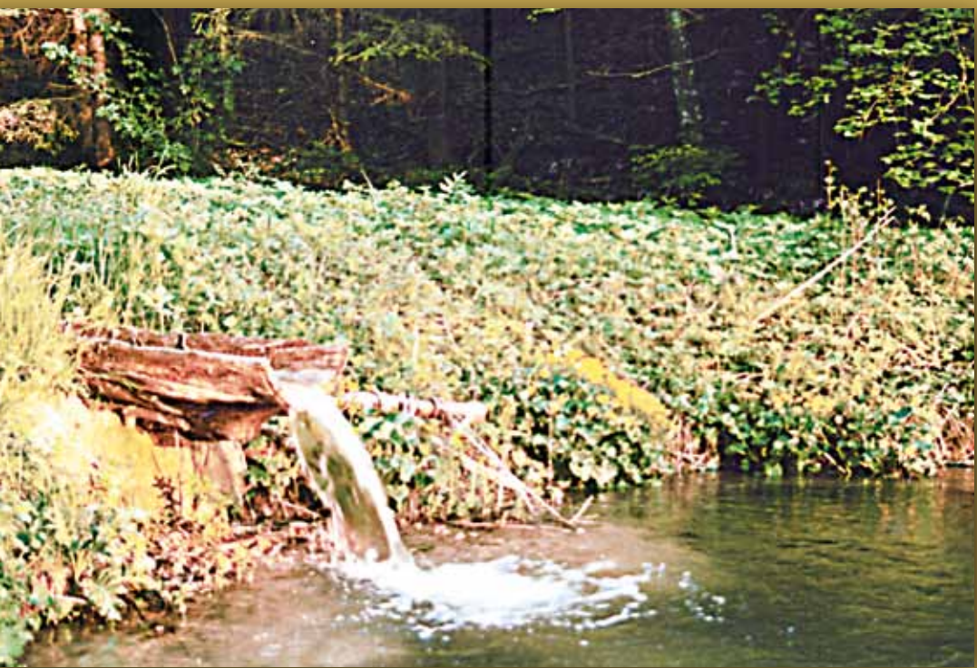
Weiler im Tiefental

Das Luftbild zeigt eindrucksvoll die Folgen der Realteilung im Erbrecht. Im Laufe von Jahrhunderten entstanden immer mehr schmale Landstreifen. Die Betriebsgrößen betragen vor dem Beginn der großen Flurbereinigung im Jahr 1964 im Durchschnitt 6 Hektar! Eine Größe die für einen modernen landwirtschaftlichen Betrieb viel zu gering war. Pfarrer Rau, der sich der evangelischen Bildungstradition verpflichtet fühlte, weckte mit einer Reihe von Vorträgen das Verständnis der Dorfbevölkerung für die Notwendigkeit einer Flurbereinigung. Letztendlich waren von 50 Betrieben nur 6 gegen die dringend benötigte Flurbereinigung. Eine